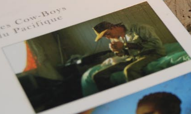
Les Cow-Boys du Pacifique